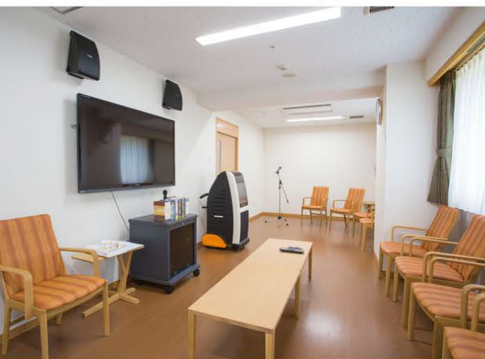
映画やカラオケを楽しんでいただけるシアタールーム