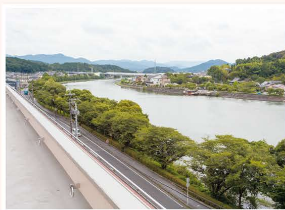
瀬田川のやさしい景色

※掲載の写真はイメージです。 ※ベッド(寝具)・収納家具等は持ち込みとなります。