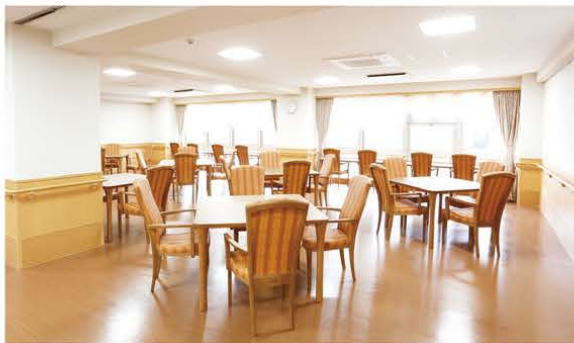
瀬田川からのあたたかい木漏れ日が差し込む食堂